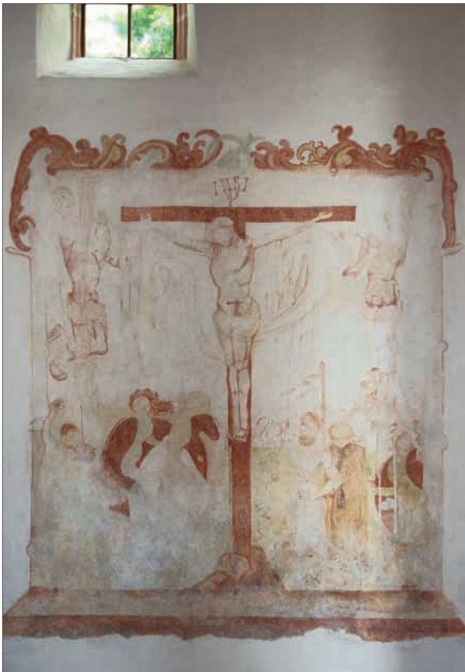
Obr. 6: Žumberk, nástěnná malba Ukřižování na severní stěně kostela, kolem poloviny 16. století.

v blízkosti Žumberka. 29) Obdobný erb užívali také vladykové z Vlášenic 30) nebo z Mostku. 31) Velmi frekventovaný byl mezi nižší šlechtou výskyt erbu s figurou okřídlené střely, spojovaný na jihu Čech především s Bavyry ze Strakonice, vymřelými na počátku 15. století. Figurou okřídlené střely neznámé barevnosti užívali na jihu Čech také vladykové z Újezdu a jejich potomci i příbuzní, dále vladykové na Štěkní a jejich potomci, také Ploskovští z Drahonice 32) nebo vladykové z Pořešína. 33) Erb s šikmým břevnem neznámé barevnosti,