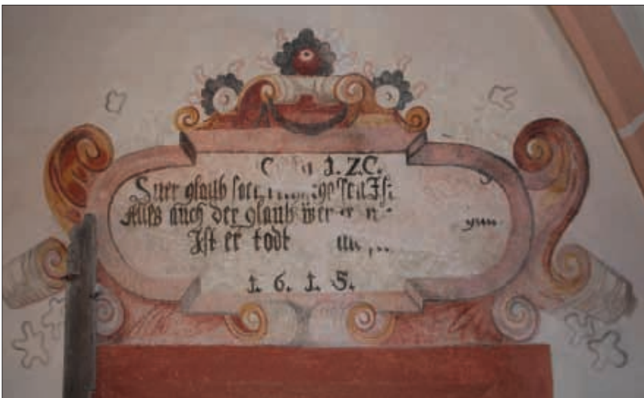
Obr. 8: Žumberk, nápisové pole na jižní stěně kůru, 1615.