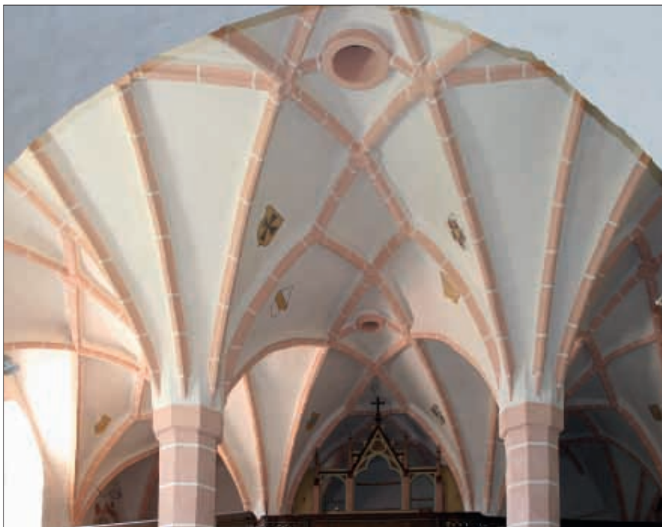
Obr. 2: Žumberk, pohled na klenbu čtyřlodi kostela sv. Jana Křtitele s erbovní výzdobou.

v souvislosti se Žumberkem zmiňován Pešík z Hrádku, který měl tehdy i podací právo ke kostelu, 3) a v letech 1370 až 1486 jsou písemnými prameny jako patroni kostela opakovaně uváděni páni z Rožmberka. 4) Zároveň tu ale sídlily vladycké rody s erbem poprsí muže s mečem, který užívali i jiné rody působící v nejnižší části Čech (vladykové z Baršova, z Jivovice, z Doudleb, z Michnic). Od roku 1383 se v písemných pramenech vyskytuje Pavlík ze Žumberka, v letech 1433–1456 se připomíná Vilém ze Žumberka, služebník Oldřicha II. z Rožmberka, jehož syn Ludvík ze Žumberka odkázal po roce 1508 žumberský majetek bratřím Stachovi a Jiříkovi z Rajbolce. Jmenovaný Stach užíval v letech 1509 a 1510 5) také predikát ze Žumberka. V přesněji nezjištěné době získal Žumberk rod Pouzarů z Michnic, rovněž s erbem poprsí ozbrojence s mečem. Volf Pouzar z Michnic si dal roku 1544 zapsat vlastnictví Žumberka do zemských desek. Tehdy k němu patřily i blízké vsi Olbramy, Chvalkov, část Kondrace a Boršíkova a dvůr v Dobré Vodě. Volfovi dědicové se o jeho majetek v roce 1549 rozdělili, přičemž Žumberk získal Jindřich Pouzar z Michnic, který patřil k předním rožmberským dvořanům a mimo jiné zastával úřad hejtmána Bechyňského kraje. 6) Po jeho smrti v roce 1600 zdědil žumberský statek syn jeho sestry Častolář Dlouhovský, který jej v roce 1602 prodal Petru Vokovi