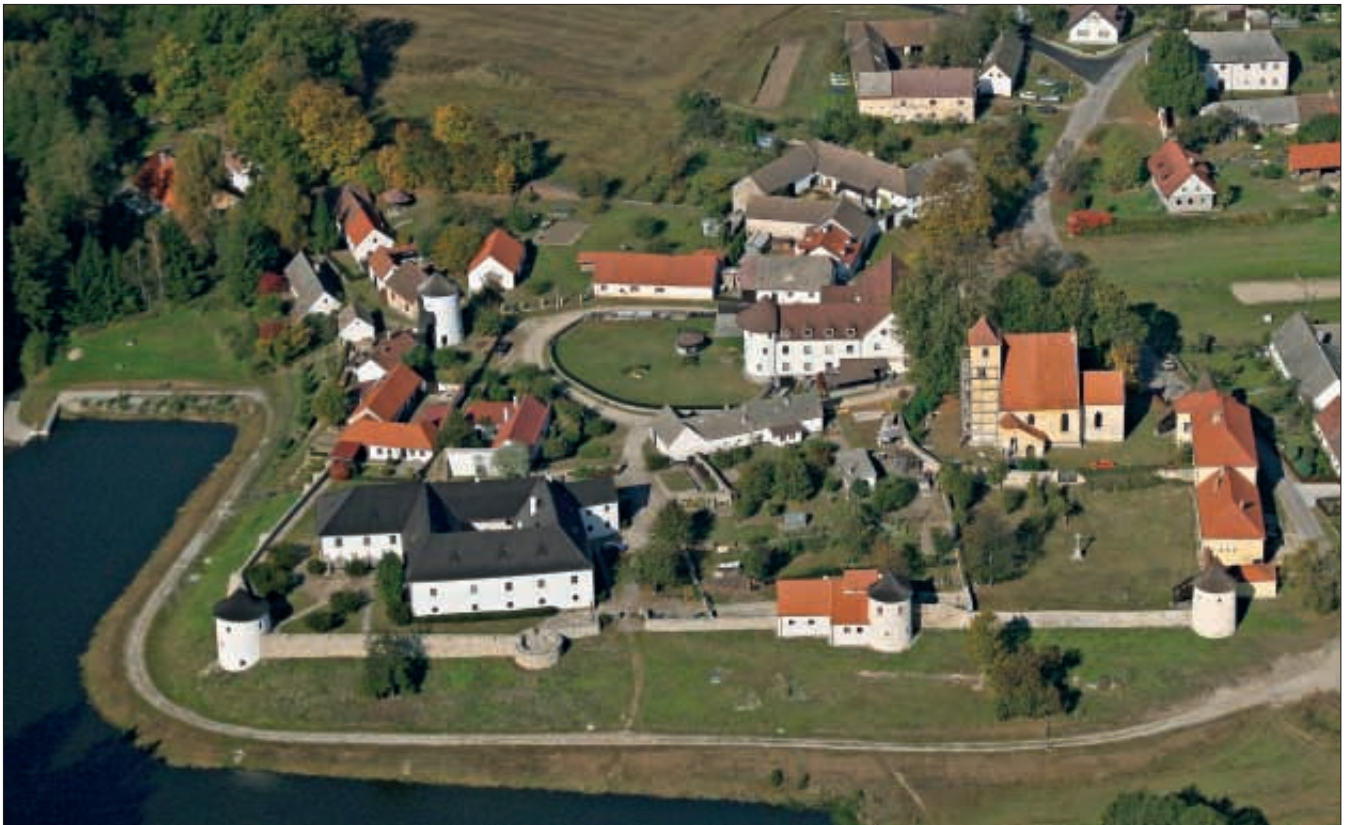
Obr. 1: Žumberk (okres České Budějovice), celkový pohled na areál tvrze s kostelem sv. Jana Křtitele a někdejšíms panským dvorem.

Kostel Stětí sv. Jana Křtitele v Žumberku u Nových Hradů (okres České Budějovice) byl postaven pravděpodobně v době kolem roku 1300 a od přesně nezjištěné doby tvořil spolu s přilehlou tvrzí a panským dvorem jeden opevněný celek. Od druhé poloviny 14. století je v písemných pramenech uváděn jako farní kostel v doudlebském děkanátu a arcijáhenství bechyňském. Původně byl vybudován patrně jako jednolodní objekt s pravoúhle ukončeným presbytářem. Na konci 14. století byl rozšířen přístavbou sakristie při severní straně presbytáře a v 90. letech 15. století následovala stavba zvonice s hvězdově sklenutým přízemím před západním průčelím. Ve stejné době byl k severní zdi interiéru presbytáře přistavěn kamenný svatostánek. Kolem roku 1505 došlo k rozšíření lodi do podoby čtyřlodí na téměř čtvercovém půdorysu, které bylo posléze k roku 1513 zaklenuto síťovou klenbou, pravděpodobně mistrem Hansem z Trhových Svinů. Současně byla v interiéru kostela vybudována čtyřdílná empora, přístupná dnes již zaniklým točitým schodištěm vpravo od hlavního vstupu. Vývoj koste-