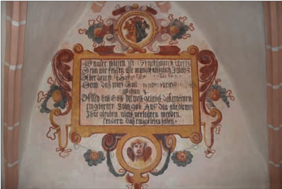
Obr. 7: Žumberk, nápisové pole s erbem Theobalda Hocka na západní stěně kůru, 1615.