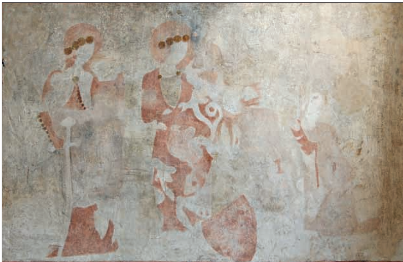
Obr. 4: Žumberk, nástěnná malba dvou světic s donátory, 1360–1390, nebo první třetina 15. století.

tánku, pravděpodobně na konci 15. století. Vpravo od Madony je v odděleném iluzivním rámu zobrazena postava světce, patrně sv. Zikmunda, podle restaurátorského průzkumu připojená dodatečně, podle formálních znaků ale patrně nikoliv s větším časovým odstupem. Obraz se dochoval ve fragmentárním stavu, lze rozpoznat, že světec je oděný do zeleného pláště, v pravé ruce drží žezlo, které má spíše podobu berly ukončené v horní části stylizovanou „kýtou“, a v levé ruce přidržuje druhý atribut – říšské jablko. Je zobrazen s dlouhými vlasy a s hustým vousem a jeho korunovanou hlavu obkružuje svatozář. Na základě výše uvedených formálních komparací a stavebněhistorických souvislostí (přístavba sakristie) lze malbu na jižní stěně presbytáře datovat do devadesátých let 14. století. Tehdy působil v Žumberku patrně farář Mikuláš, který byl do úřadu instalován v roce 1379 po rezignaci kněze Petra pod patro-