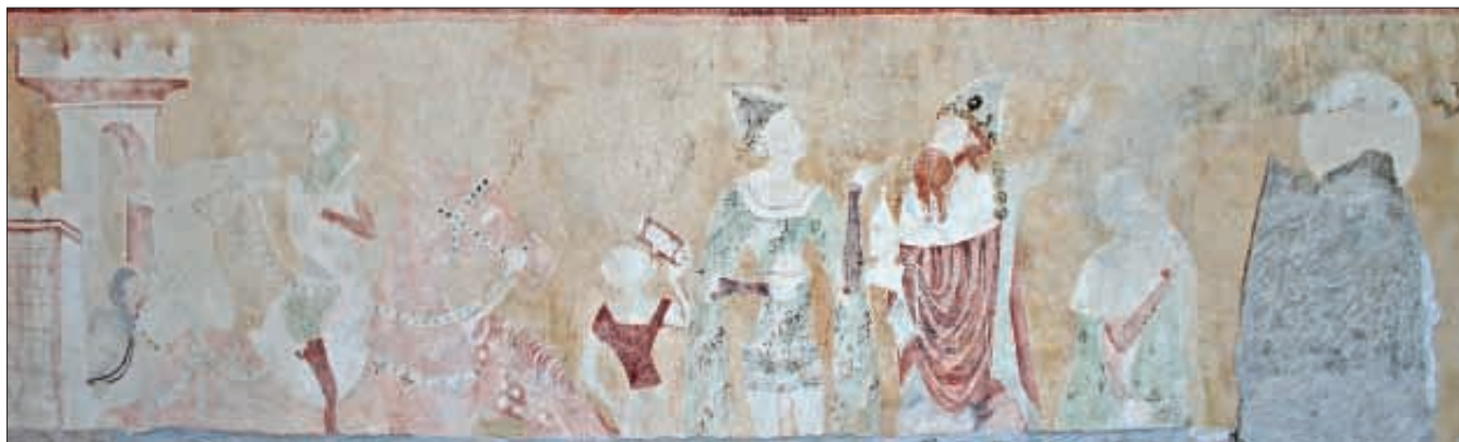
Obr. 3: Žumberk, nástěnná malba Přijezdu a Klanění tří králů, 90. léta 14. století.